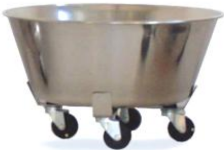
Réf : VET4045RA

Round waste bin with trolley 304 stainless steel 14L basin. 4 antistatic wheels Ø 50mm or 3 antistatic wheels Ø 50mm.