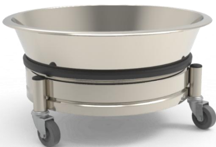
Réf : VET4046RA

Bac rond à déchets avec chariot et joint anti-bruit. Bassine 14L en inox 304. 3 roulettes antistatiques Ø 50 mm